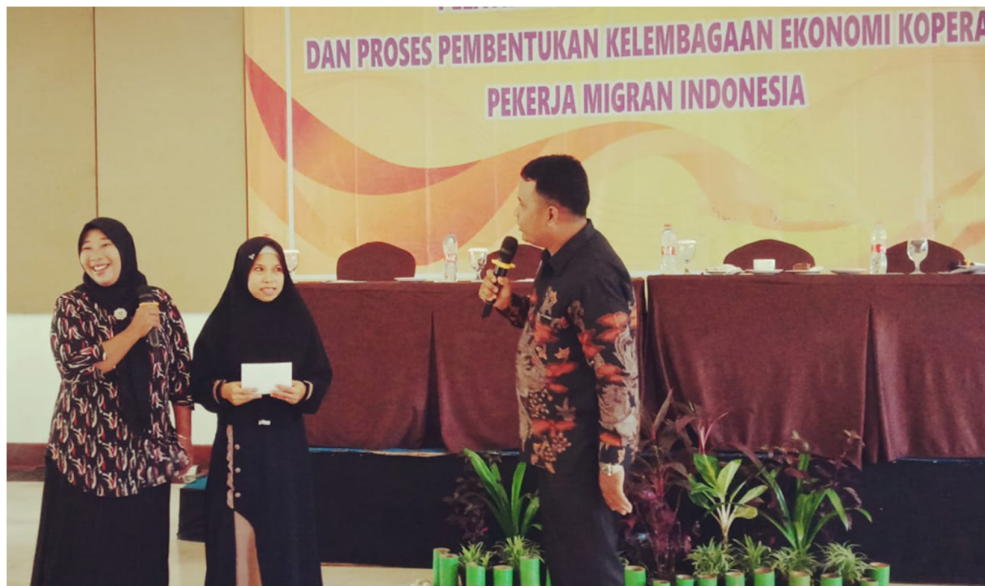
Gambar 4. Paparan Kelompok