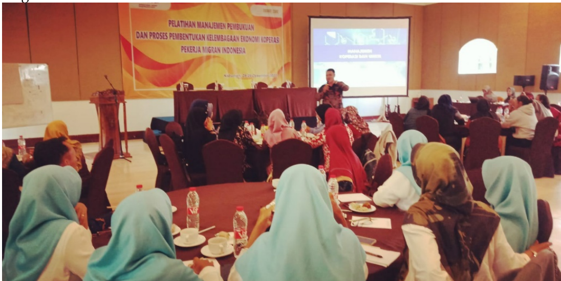
Gambar 2. Penyampaian Materi

Materi selanjutnya yaitu pengambilan keputusan bisnis. Peserta diarahkan untuk membahas aspek pengambilan keputusan bisnis dalam konteks koperasi. Peserta mempelajari teknik analisis bisnis, penilaian risiko, strategi bisnis, pemasaran, dan manajemen operasional yang berkaitan dengan koperasi. Hal ini bertujuan untuk membantu peserta dalam mengambil keputusan yang baik dan mengembangkan strategi bisnis yang efektif. Untuk gambaran mengenai kegiatan pelatihan dapat dilihat pada gambar, gambar 3 dan gambar 4.