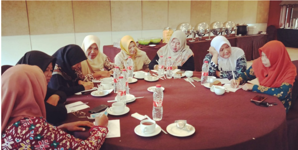
Gambar 3. Proses Diskusi Kelompok