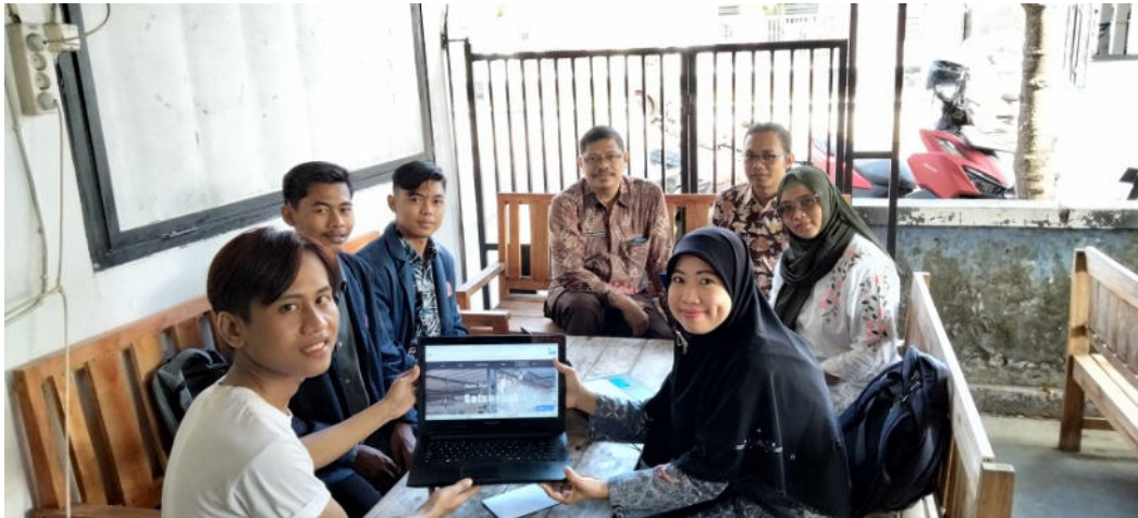
Gambar 4. Dokumentasi foto bersama hasil produk Website