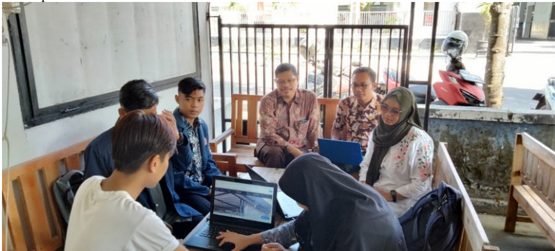
Gambar 3. Edukasi pelaksanaan kegiatan PkM

Dokumentasi pelaksanaan kegiatan Pengabdian kepada Masyarakat (PkM) dapat dilihat pada Gambar 3.